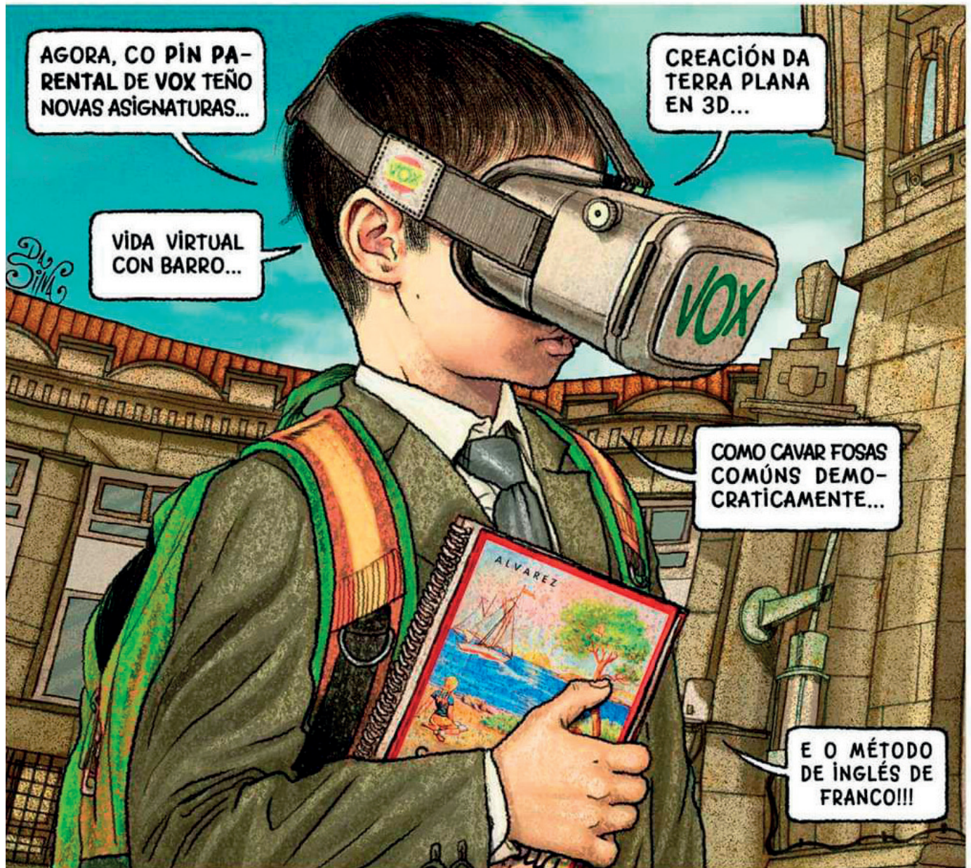
Viñeta de Kiko da Silva